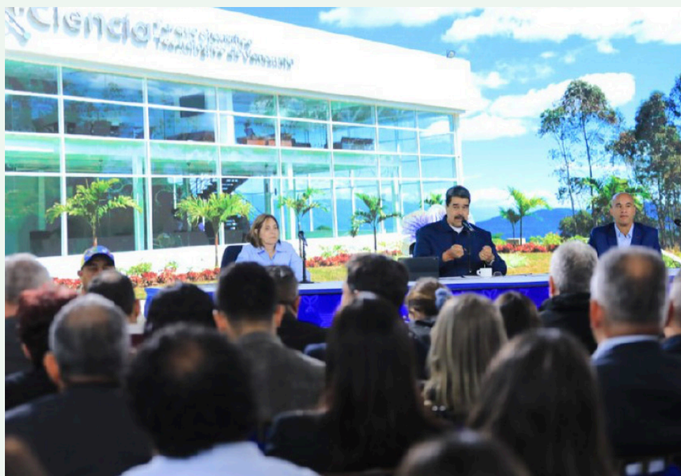
Inauguración del Parque Científico Tecnológico de Venezuela «+ Ciencia» por parte del presidente de la República Bolivariana de Venezuela, Nicolás Maduro Moros

En el marco de este lanzamiento, los asistentes y participantes de este evento de Ciencia Abierta de América Latina y el Caribe tuvieron la oportunidad de participar en la inauguración del Parque Científico Tecnológico de Venezuela «+ Ciencia» , ubicado en los espacios del Instituto Venezolano de Investigaciones Científicas (IVIC), los Teques, Estado Miranda, por parte del presidente de la República Bolivariana de Venezuela, Nicolás Maduro Moros.